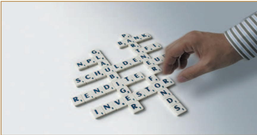
Wie beim Dominospiel, eins muß ins andere passen, Gläubiger, plus Schuldner, Investor, plus Rendite ergibt die sichere Anlage im NPL-Fonds

Ebenso simpel wie das Ei des Kolumbus ist das Servicing von Kreditforderungen der Firma Task Force Investor